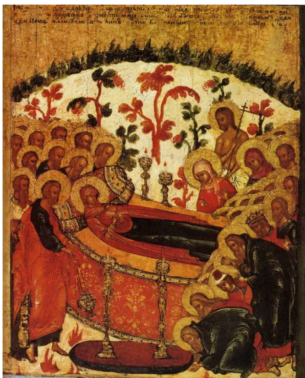
Zesnutí Přesvaté Bohorodičky

I nyní: Bohorodičník: Nezahanbitelná zastánkyně křesťanů a neustálá orodovnice u Tvůrce, nepohrdej hlasy modliteb hříšníků. Pospěš dobrotivě na pomoc nám, kteří vroucně k tobě voláme: „Urychli modlitbu a upros Vládce. Oroduj vždy, Bohorodičko, za ty, kteří tě uctívají.“